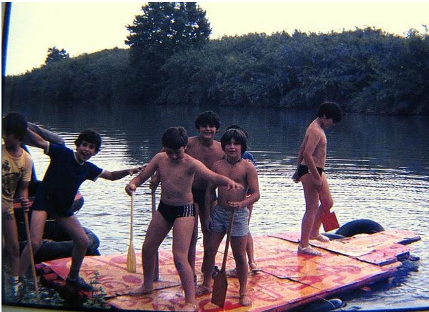
Al agua, a pelo y tan contentos (Rangers, descenso del Xúquer, 1980)

A veces nos hemos aventurado por glaciares y neveros sin crampones, cuerdas ni piolets, o calzados con zapatillas de deportes. O hemos montado balsas sin las más mínimas medidas de seguridad —chalecos, flotadores, cuerdas y amarres—, como se puede ver en las fotos de la aventura que organizaron los rangers en 1980 para bajar el Xúquer.