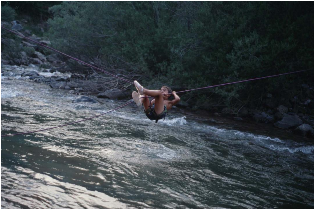
El riesgo, inherente al scout (tirolina en Hecho, 1997)