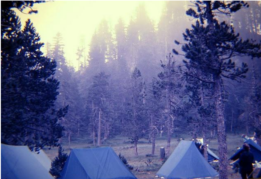
Las nieblas perpetuas de Salardú (1986)

llengua, ya nos extendemos en la opción “País”—; lugares muy elevados, lluviosos y fríos, de acceso muy complicado, como en Àreu o Gistaín; u otros demasiado calurosos y, por tanto, insufribles: en Cazorla, los médicos no podían tomar la temperatura a los enfermos hasta la noche, porque de día no bajaba nunca de 40° —ni que decir tiene que nunca volvimos—.