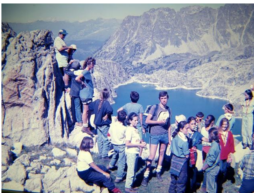
Los rangers lo flipan a la vista de l'Estany de Mar (1986)

En Salardú, a los jefes de rangers se les ocurrió meter a las dos tropas por una canal empinadísima que desembocaba en el coll de Güellacrestada, a 2.800 metros de altura; tardaron un día entero, claro, con un desorden descomunal. ¿No había una ruta más sencillita?