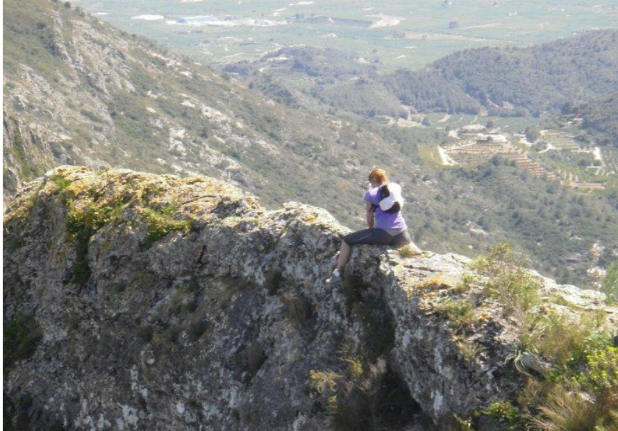
El paso “cabalgando” (Serra de les Agulles), con el abismo a ambos lados

Sirvan estas líneas para pedir, de cara a los próximos cincuenta años, un esfuerzo adicional de prevención y de planificación. Aunque, a decir verdad, el número de incidentes ha descendido mucho en las dos últimas décadas. La mejora de los materiales, la aparición de nuevos inventos técnicos —el GPS y el teléfono móvil, por ejemplo—, el desarrollo de los equipos de rescate, o de las técnicas de cartografía —mapas mucho mejores y precisos—, y hasta internet, que nos sirve para comprobar las rutas y recoger las experiencias de los que ya han pasado por ellas..., todo ello ha repercutido en unos índices de seguridad envidiables a principios de los ochenta. También, la propia experiencia del grupo: ya no se sube, sino que se baja Añisclo, y dentro de un volante, no de un campamento de quince días; no bajamos a simas ni a cuevas, sin que ello impida que alguno se apunte por libre a un club de espeleología; vamos a sitios que ya conocemos y de los que nos sabemos los riesgos; los padres, muchos de los cuales ya han sido scouts, también son capaces de valorar esos riesgos. Cuando redactábamos este apartado del libro, nos resultaba difícil hallar anécdotas que contar a partir de 1990... La seguridad en nuestras actividades ha aumentado, y bastante. En fin, que cincuenta años dan